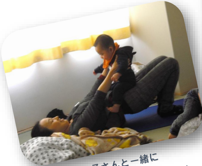
お子さんと一緒に 楽しい時間が過ごせます